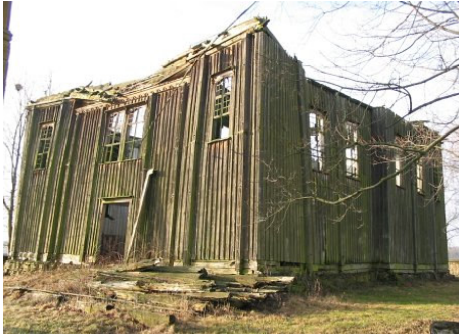
Graužiškių Šv. Petro ir Povilo bažnyčios griuvėsiai

Graužiškių Šv. Petro ir Povilo bažnyčios griuvėsiai (XVIII a. II p.). Pirmąją bažnyčią šioje vietoje fundavo dvaro savininkas Mikalojus Butrimas 1495 metais. Bažnyčia perstatyta XVII a. vid. ir XVIII a. viduryje. Bažnyčia sugriuvusi, todėl spręsti apie jos architektūrą sunku. Tai medinis liaudies architektūros su baroko stiliaus bruožais sakralinis pastatas. Bažnyčios šventorių supa lauko akmenų tvora, šventoriuje gerai išlikusi stačiakampio plano dviejų tarpsnių liaudies architektūros medinė varpinė (XIX a. pab. – XX a. pr.).