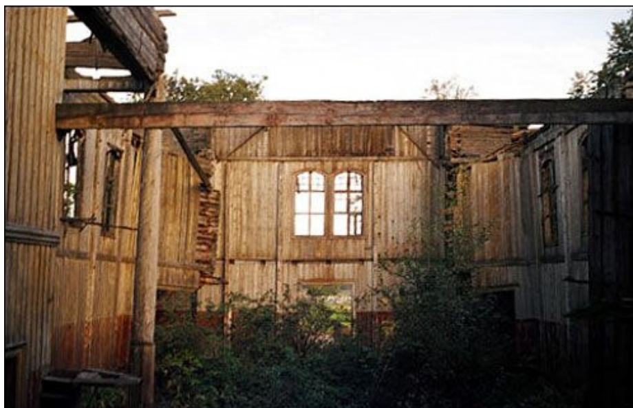
Graužiškių Šv. Petro ir Povilo bažnyčios griuvėsiai